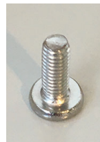
3/4" Allen Head Screws