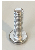
7/8" Allen Head Screws